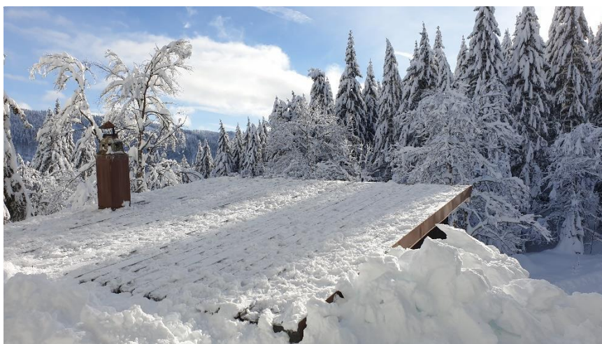
Bild 2: Abschaufel-Aktion vom 16.01.2021 an der Oberen Rotenbachhütte